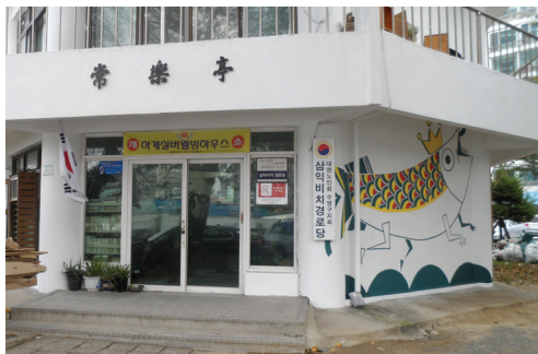
▲ 수영구 삼익비치경로당 리모델링 후 모습