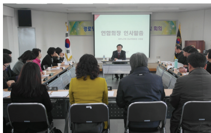
▲ 경로당순회프로그램관리자 교육모습 (연합회장 인사말씀)

대한노인회 경상남도경로당광역지원센터(회장 신희범, 경로당광역지원센터장 이수익)에서는 “2015년 상반기 경로당순회프로그램관리자 교육 및 회의”를 경남연합회 3층 강당에서 경로당광역지원센터 직원 5명, 지회 경로당순회프로그램관리자 20명(총 25명)이 참석한 가운데 개최하였다.