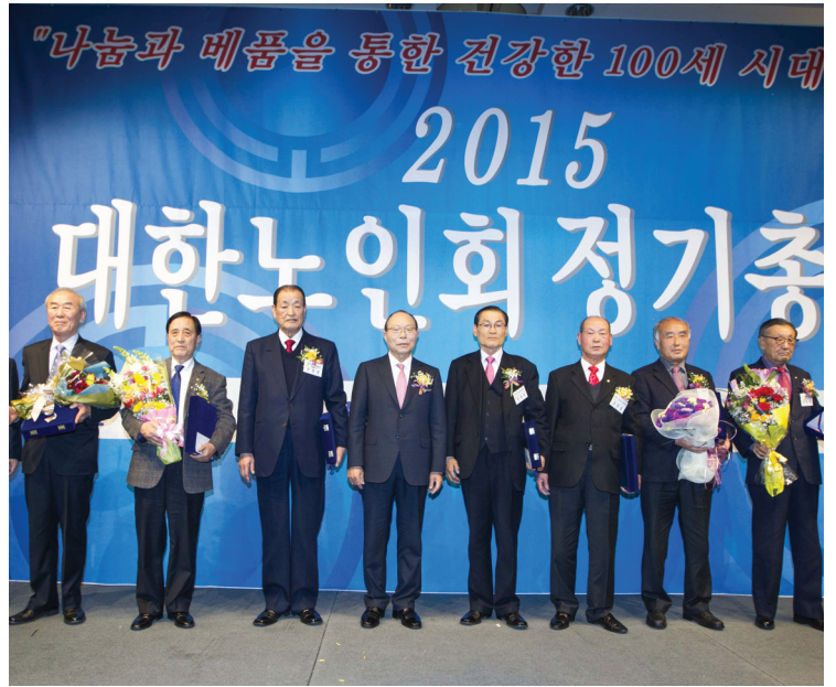
▲ 2015년 대한노인회 정기총회에서 대의원들이 의안을 통과시키고 있다.