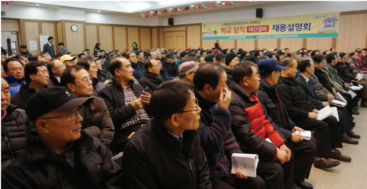
▲ 채용 설명회 참여 어르신

이번 채용 설명회를 통해 대한노인회 취업지원센터가 취업을 희망하는 어르신들을 위해 해야 할 일이 많다는 것을 다시 한 번 생각해보게 되는 계기가 됐으며 앞으로도 꾸준히 지역 업체와의 유대관계를 통해 어르신들 일자리 마련을 위해 노력할 계획이다.