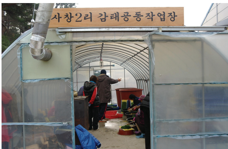
▲ 공동작업장 전경

유병찬 태안군 취업지원센터장은 추위에도 이랑곳 하지 않고 매일 바닷바람도 신선하다며 기쁨이 가득한 어르신들을 보며 한 분의 어르신이라도 더 좋은 일자리를 마련 할 것을 다짐했다.