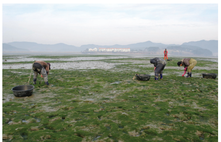
▲ 작업현장 모습