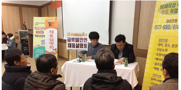
▲ 어르신 단체 면접