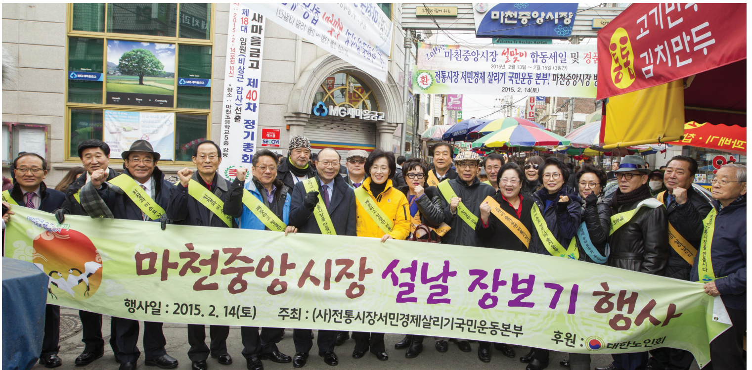
▲ 서울 송파구 마천 중앙시장에서 설을 맞아 2월 14일 '설맞이 마천중앙시장 장보기' 행사를 개최하고 있다.

대한노인회는 마천중앙시장에서 민족의 명절인 설을 맞아 지난 14일 설 성수품을 저렴하게 구매할 수 있는 '설맞이 마천중앙시장 장보기' 행사를 개최했다.