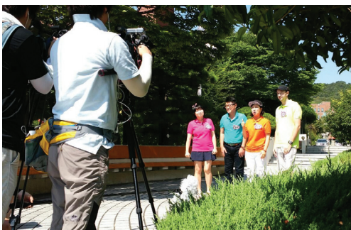
▲ 미라클하우스 촬영 모습

이번 방송으로 인해 노인들의 네트워크 공간인 경로당을 밝고 활기찬 공간으로 바꿔주는 계기가 되기를 기대해 본다.