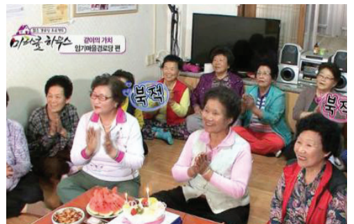
▲ 미라클하우스 TV방영 모습