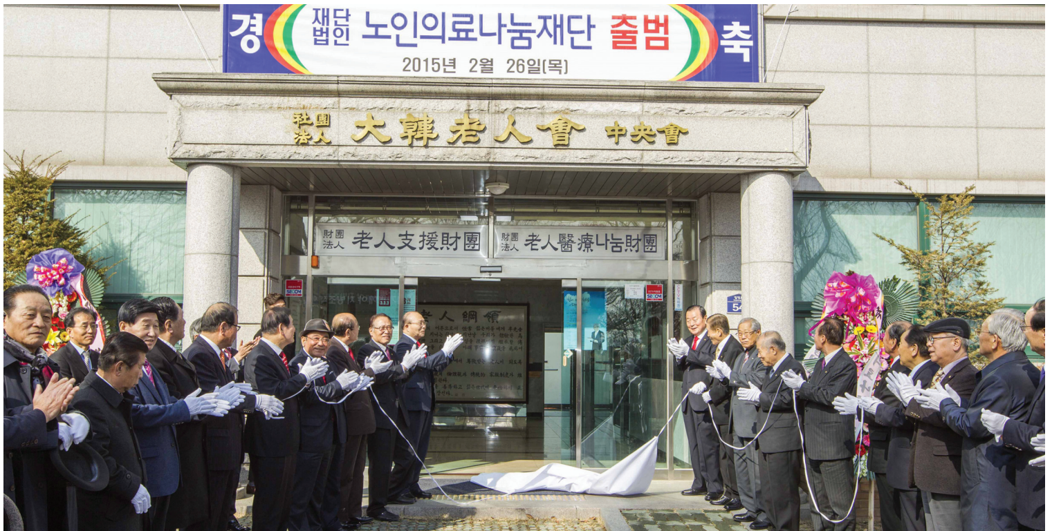
▲ 대한노인회 중앙회에서 2월 26일 노인의료나눔재단 현판식을 거행하고 있다.