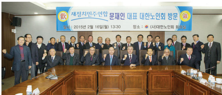
▲ 새정치민주연합 문재인 대표가 2월 16일 대한노인회 중앙회를 방문해 어르신들의 건의사항을 듣고 기념촬영을 하고 있다.

방비 6백억 원도 정부가 예산에서 제외한 것을 새정치연합이 확보한 것”이라고 말했다. 또 “이제 우리가 100세 시대를 맞이했는데 당이 어르신들을 정말 제대로 모시는 그런 효도 정당이 되도록 각별하게 노력을 기울이겠다”고 약속했다.