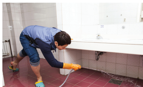
▲ 중앙회 직원들이 즐거운 마음으로 봉사를 하고 있는 모습