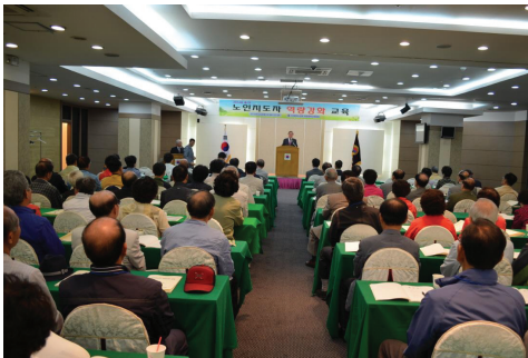
▲ 개회사(김탁 대전광역시연합회장)