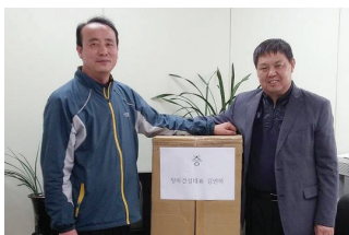
▲ 창하건설에서 후원품 전달 모습

대한노인회 평창군지회(지회장 고영배, 센터장 안영은) 취업지원센터는 지난 4월 2일 청하건설(사장 김연하)로부터 홍보물품을 후원받았다. 창하건설은(평창군 평창읍 하리 소재) 토목건설회사