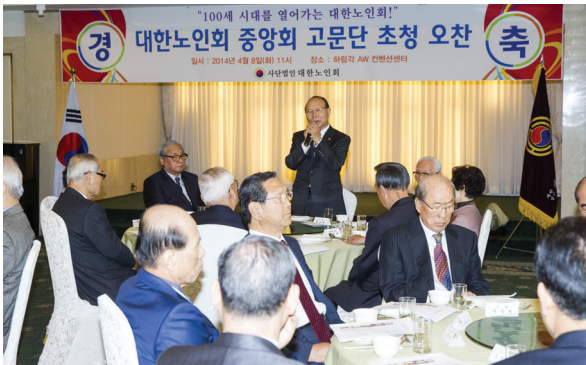
▲ 대한노인회가 4월 8일 서울 하림각 AW컨벤션센터에서 고문단 초청 오찬행사를 진행하고 있다.