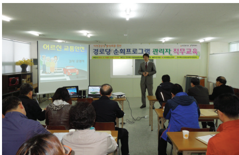
▲ 직무교육을 받고 있는 전경

전전라북도 경로당광역지원센터(회장 김규섭, 센터장 김정희)는 경로당 활성화를 위한 경로당 순회프로그램관리자 직무교육을 경로당광역지원센터 교육장에서 4월 4일(금) 실시하였다.