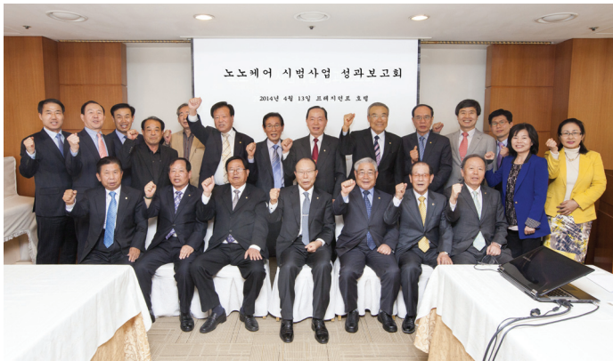
▲ 대한노인회가 4월 13일 서울프레지던트호텔에서 노노케어 시범사업 수행 10개 우수지회에 대한 성과보고회를 가지고 기념촬영을 하고 있다.