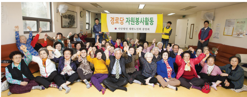
▲ 경로당 회원들과 중앙회 직원들의 기념촬영

이날 경로당중앙지원본부 직원들의 영화상영, 안마, 청소 등 다양한 봉사활동을 시작으로 각 지역 경로당광역지원센터에서 모범경로당 순회방문이 이어지길 기대해본다.