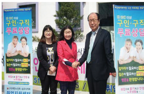
▲ 속초법륜영농조합법인에서 후원품 전달 모습

일 사업설명회 및 공개면접 실시로 채용했으며, 앞으로도 근로 능력과 열정이 있는 우리 지역 어르신들의 일자리 창출에 적극 기여할 것이라고 밝혔다. 대한노인회 속초시지회 취업지원센터는 만 60세 이상 어르신들에게 민간취업 무료 알선 및 취업연계를 통해 활기찬 노년을 지원하기 위해 취업지원센터를 운영하고 있으며, 취업이 필요한 어르신과 일손이 필요한 관내 기업체를 대상으로 무료 맞춤 상담에서 취업 연계까지 지원하므로 속초시 어르신들에게 꿈을 이루는 기관으로 자리매김하고 있다.