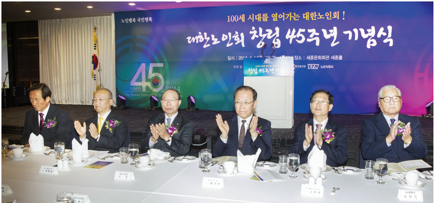
▲ 4월14일 세종문화회관 세종홀에서 열린 대한노인회 창립45주년 기념식에서 이 심 회장 등 참석자들이 박수를 치고 있다. 왼쪽부터 정몽준 새누리당 서울시장 예비후보, 문형표 보건복지부 장관, 이 심 회장, 황우여 새누리당 대표, 오제세 국회 보건복지위원장, 정원식 전 국무총리.