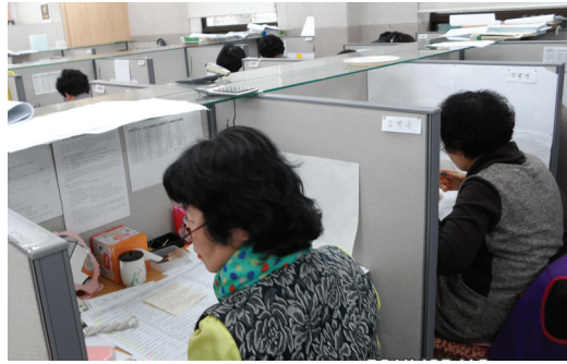
▲ 실버텔레마케터 취업자 근무 현장 모습

환경실태 일제조사』에 현장 조사 활동을 벌이는 실버 조사원과 현장 조사원 투입 전에 산업체 조사 활동에 대한 안내와 개략적인 산업체 현황 파악을 담당하는 실버 텔레마케터를 사업 수탁 회사인 (주)KDN(한국데이터네트워크)에서 3월부터 모집하여 현재 실버 텔레마케터 5명이 취업하여 활동하고 있으며 실버조사원 4월 20