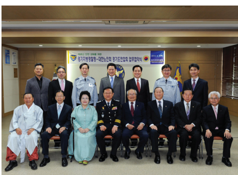
▲ 업무협약 후 기념 촬영하는 모습

노년기 행복의 조건, 대한노인회 소개 및 노인지도자의 역할, 고령사회 위기와 경로당 활성화방안, 관계 형성 등의 교육을 통해 역량강화의 중요성을 깨닫고 의식개혁은 나부터라는 공감대를 형성하는 기회가 되었다. 전원 교육을 이수하고 수료증을 전달받았다.