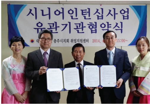
▲ 시니어인턴십 협약식 모습