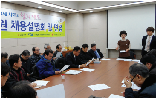
▲ 실버조사원 채용설명회 모습